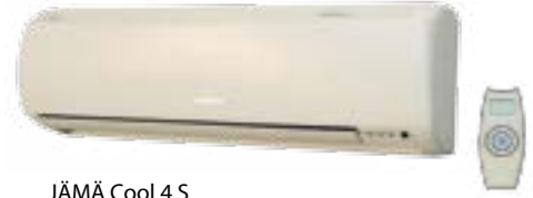
JÄMÄ Cool 4 S

Jämä Cool 4S on seinäkiinnitteinen viilennyskonvektori, jonka maksimiviilennysteho on 4 kW. Jämä Cool 5K on kattokiinnitteinen viilennyskonvektori, jonka maksimiviilennysteho on 5 kW. Viilennyskonvektorit eivät tarvitse talon ulkopuolelle sijoitettava ulkoyksikköä, vaan kaikki kytkennät tehdään suoraan maalämpöpumppuun.