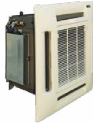
JÄMÄ Cool 5 K